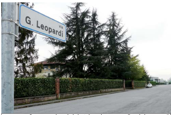
La costruzione inizierà in primavera - Servizio a pag. 5