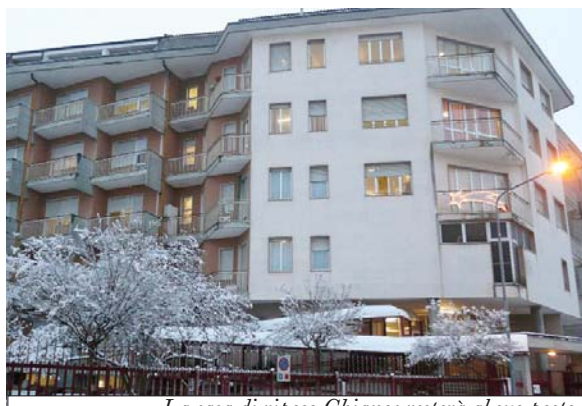
La casa di riposo Chianoc resterà al suo posto

Chianoc, avanti tutta. È stato siglato il protocollo per salvare la casa di riposo e giovedì 30 dicembre, pur con qualche malumore, è giunto il placet da parte del Consiglio comunale appositamente convocato. La Chianoc verrà rimessa a nuovo con una capienza massima di 140 posti e sarà gestita dal Consorzio Obiettivo Sociale di Paolo Spoladore, che già amministra molte case di riposo tra cui quella di Genola. In parte dello stabile l'Atc costruirà una